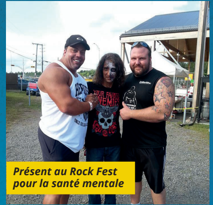
Présent au Rock Fest pour la santé mentale