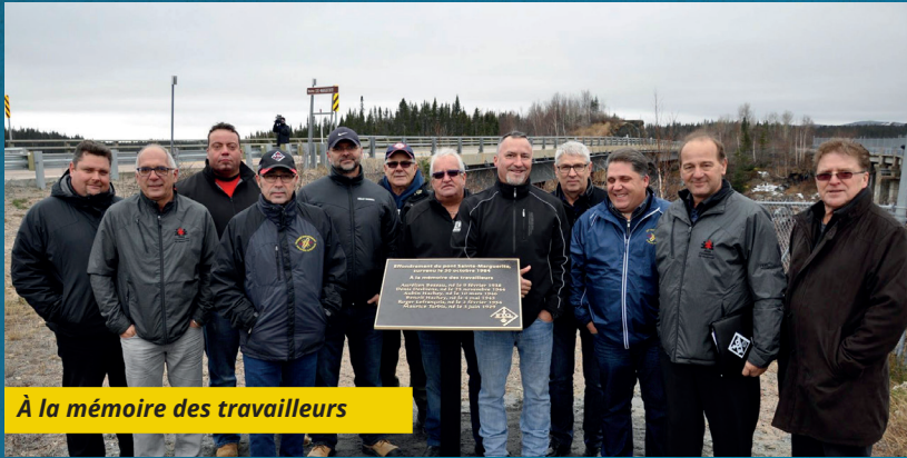
À la mémoire des travailleurs