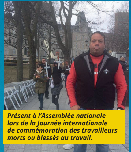
Présent à l'Assemblée nationale lors de la Journée internationale de commémoration des travailleurs morts ou blessés au travail.